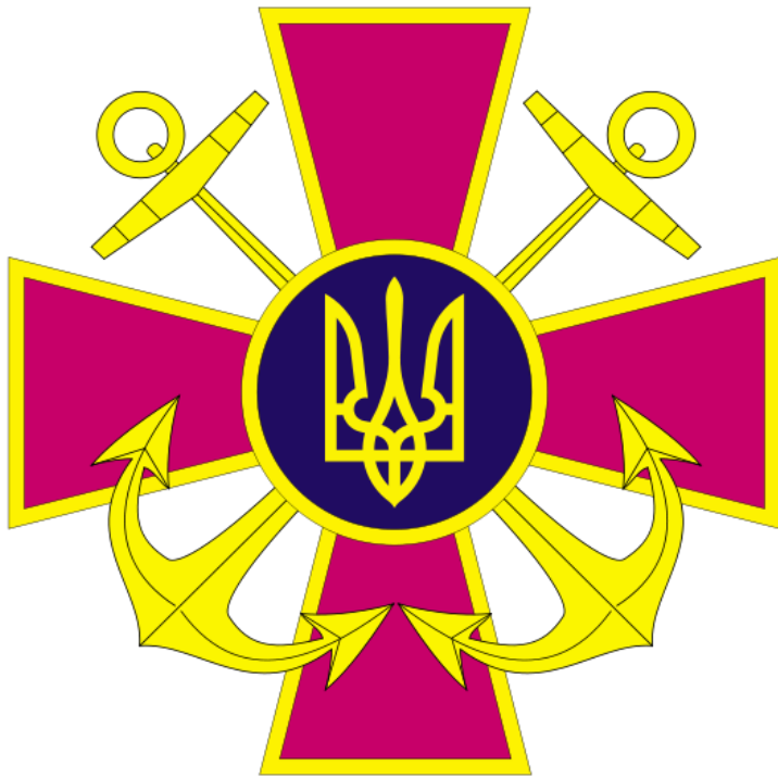
Емблема Військово-Морських сил України