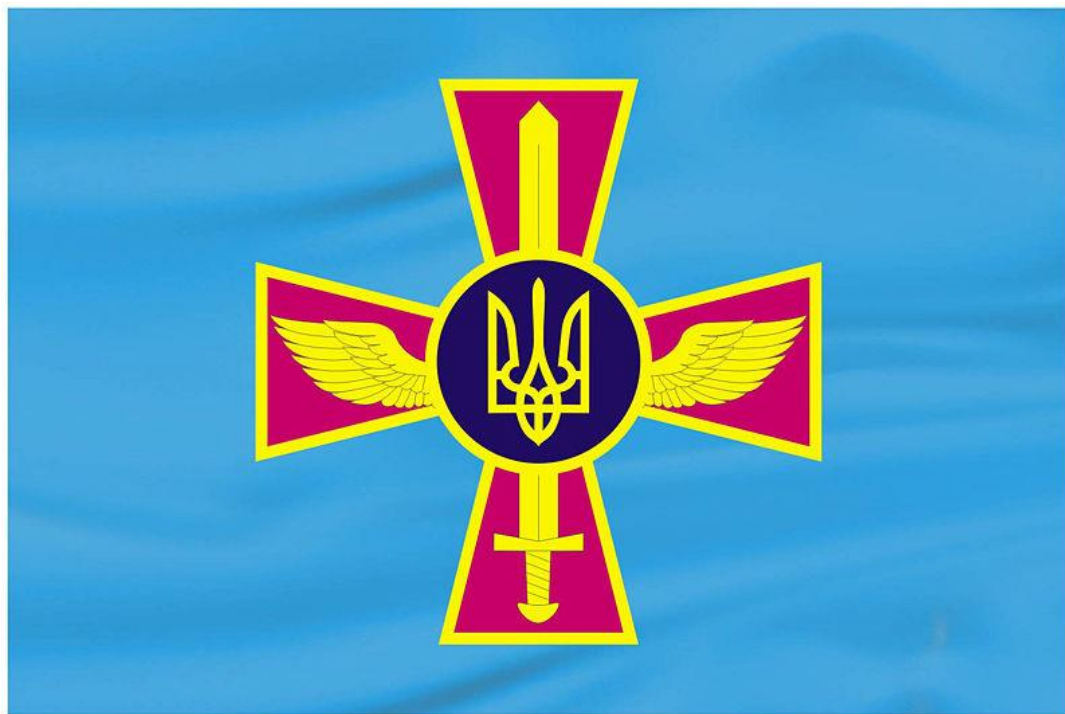
Прапор Повітряних сил України

Повітряні Сили Збройних Сил України — які існують у складі Збройних сил України з 2005 року. Створено шляхом об'єднання двох видів: Військово-Повітряних Сил та Військ Протиповітряної оборони країни .