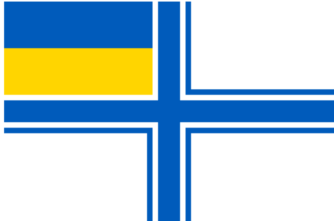
Прапор Військово-Морських сил України

Військово-Морські Сили Збройних Сил України — вид Збройних Сил України, призначений для захисту суверенітету і державних інтересів України на морі, розгрому угруповань ВМС противника в своїй операційній зоні самостійно та у взаємодії з іншими видами Збройних Сил України, сприяння Сухопутним військам України на приморському напрямку. У складі ВМС України служить 15470 осіб. На озброєнні 4 корвети , 3 фрегати , 1 підводний човен, 26 допоміжних кораблів і 35 літаків.