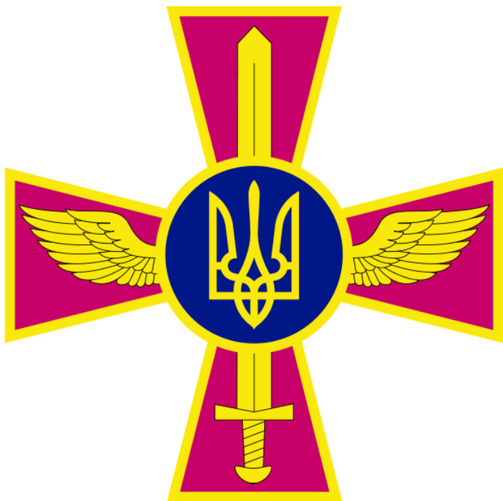
Емблема Повітряних сил України